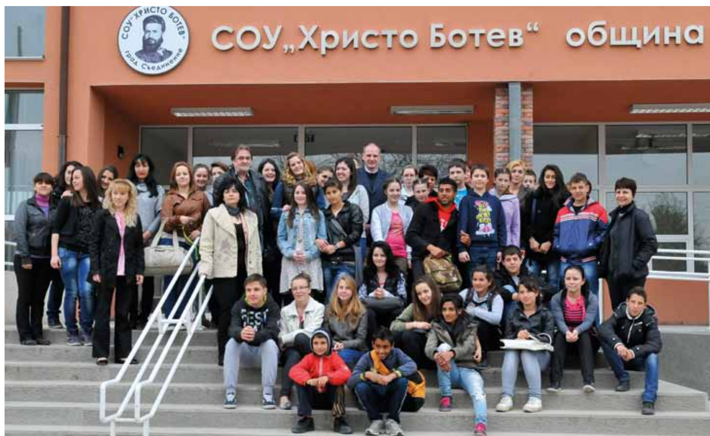
Szuedinenie-i testvériskolánk előtt