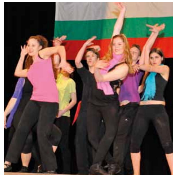
Fellépés Szuedinenie kulturházában

A következő fellépésünk színhelyére, egy Szent György napi jótékonyági előadásra busszal utaztunk, bolgár