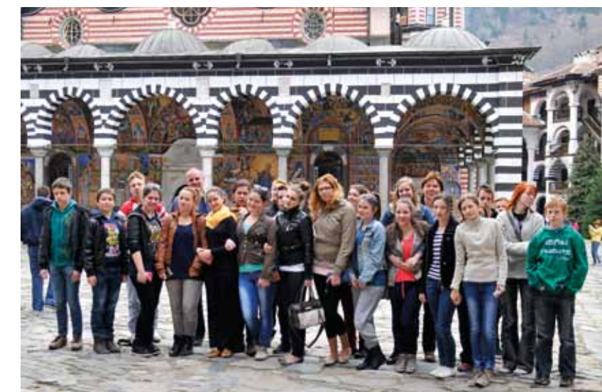
A rilai kolostor

barátaink kíséretében. Műsorunk itt is hatalmas sikert aratott, ami nem is csoda, hiszen a helyieknek nem mindennap adatik meg, hogy külföldi előadást láthassanak.