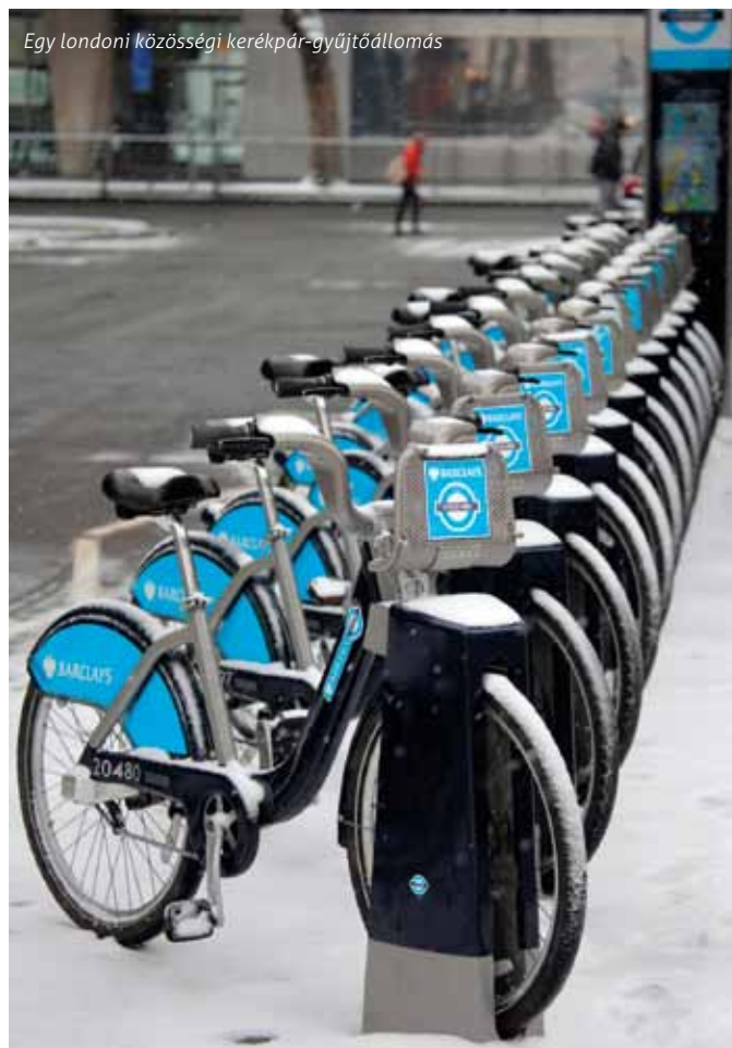
Egy londoni közösségi kerékpár-gyűjtőállomás